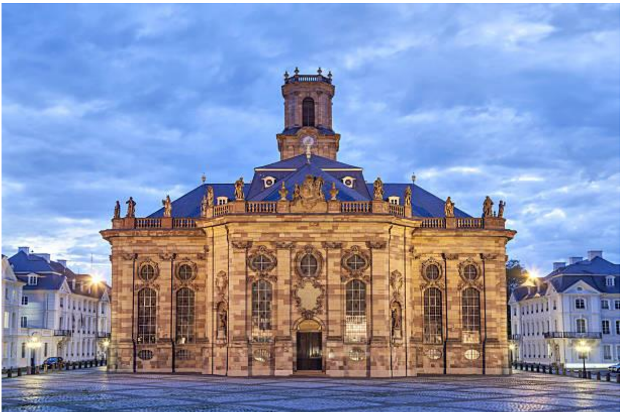
Westliche Kirche Fassade und Turm der Ludwigskirche in Saarbrücken